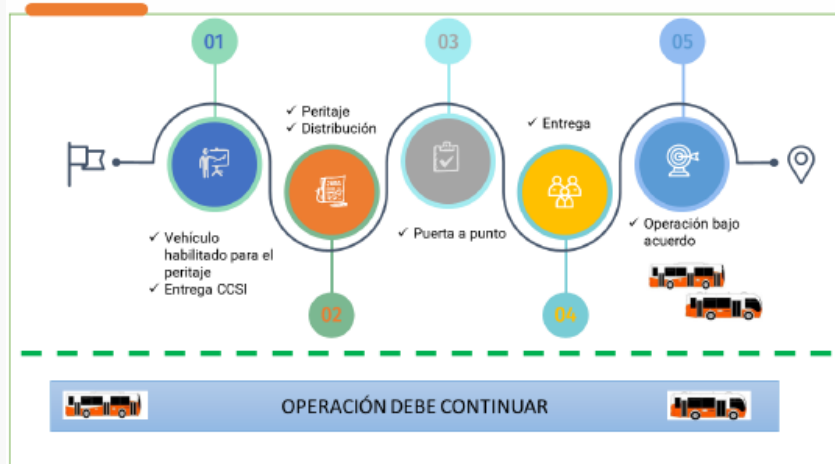
Imagen 3: